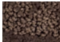
Wengé 691 4 m L 29,7 - p 6,1*