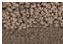
Cendre 771 4 m L 40,2 - p 11,4*