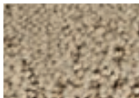
Grès 741 4 m L 60,3 - p 28,5*