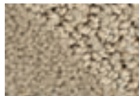
Grès 741 4 m L 60,3 - p 28,5*