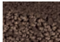
Wengé 691 4 m L 29,7 - p 6,1*