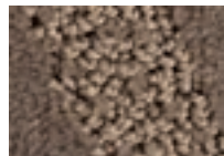
Cendre 771 4 m L 40,1 - p 11,3*